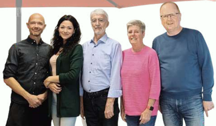
Der erweiterte KSG-Vorstand v. l. n. r.: