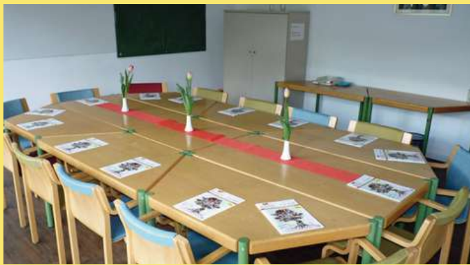
Seminarraum: ca. 35 qm

Raumüberlassung für private Anlässe, Seminare, workshops, Ausstellungen in den Abendstunden und am Wochenende, Eigentümerversammlungen und vieles mehr... Unsere schönen, zentral gelegenen Räume im Uni-Center, Luxemburger Str. 136, 50939 Köln, können Sie für Ihre Veranstaltungen anmieten.