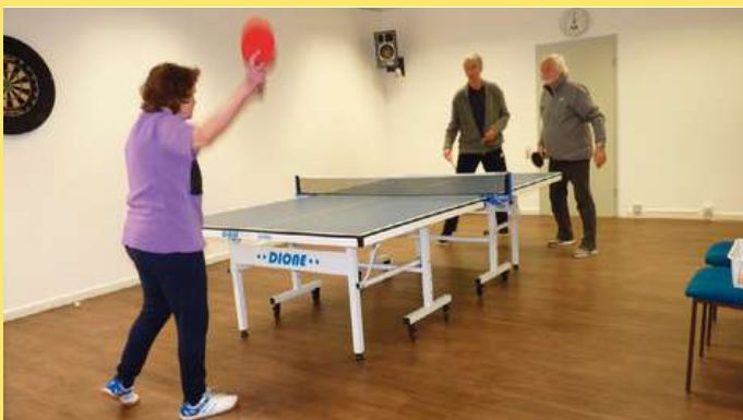
Bewegungsraum: ca. 40 qm

(Kontaktdaten siehe Seite 31 - Impressum)