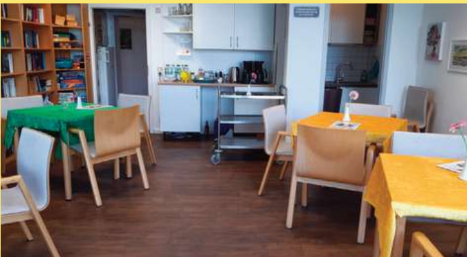
Cafeteria: ca. 35 qm

Der große Saal ist mit Leinwand, Beamer, Flipchart, Tonträgern wie Musikanlage, Klavier und Bühne ausgestattet. Hier ist genug Raum für ca. 100 Personen.